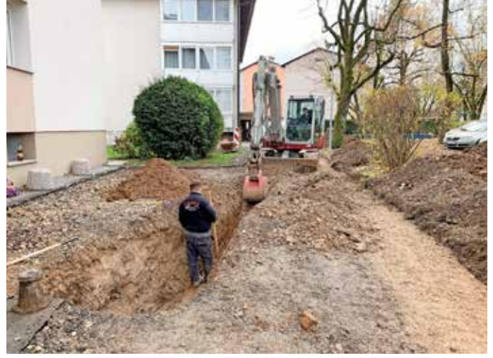
Vodovod obnavljajo zaradi dotrajanosti.