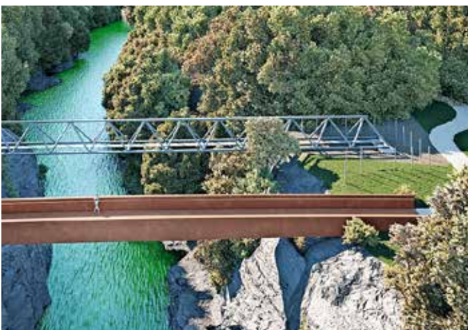
Idejna zasnova mostu čez Kokro

Mestna občina Kranj zaključuje projektiranje povezave za pešce in kolesarje, ki bo povezala športni park in Zlato polje z industrijsko cono IBI ter Primskovim. S tem bodo občani Kranja dobili krajšo trajnostno povezavo tako s športnim parkom kot z industrijsko cono IBI, hkrati pa se bo za javnost odprla dragocena zelena površina ob kanjonu reke Kokre, poudarjajo. Vlogo za izdajo gradbenega dovoljenja bodo vložili predvidoma v začetku leta 2022. V primeru odobrenega sofinanciranja z evropskimi sredstvi bi gradnjo lahko začeli že v drugi polovici leta 2022, projekt pa končali v letu 2023.