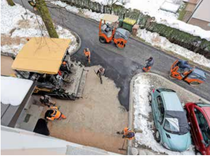
Do konca leta bodo skušali cestišče vsaj grobo asfaltirati.