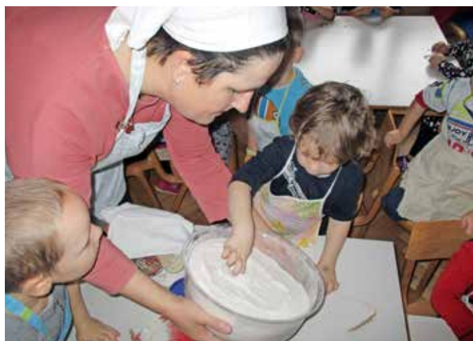
Delavnica peke domačega kruha

Kekec že večkrat sodelovala na sejmu ekošole Altermed, smo potrebovali tudi mleko, jabolka, zelje ... in v tesnem sodelovanju smo dosegli čudovite rezultate: srebrno priznanje za projekt o zelju, zlato priznanje za Kekčevo čežano (novo blagovno znamko) in zlato priznanje za Kekčev jogurt (novo blagovno znamko). Letošnje šolsko leto pripravljamo projekt o korenju. V sodelovanju s kmetijo otrok spoznava živali in odpravlja strah pred njimi. Otrok spoznava in podpira lokalnega pridelovalca, spoznava sezonsko hrano, raznoliko in zdravo. Razvija pozitiven odnos do hrane, se seznanja s postopkom priprave hrane in aktivno sodeluje v procesu priprave in uživanja hrane. Upošteva tudi kulturno dimenzijo in sledi ohranjanju slovenske kulturne dediščine. Otrok razvija tudi predstavo o zmanjševanju odpadkov.