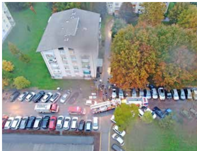
Z gasilskimi vozili se do "gorečega" bloka ni dalo pripeljati.

Mestna občina Kranj se je tudi zaradi omenjene vaje odločila, da bodo intervencijske poti označili tudi v Šorlijevem naselju, in sicer najprej na lokacijah, ki so jih že maja letos prepoznali kot najbolj problematične, ker imajo intervencijska in komunalna vozila tam otežen ali celo onemogočen dostop.